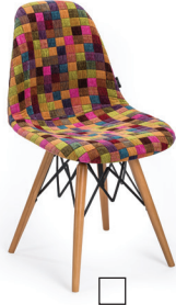
EOS-V Sandalye Chair EOS-V