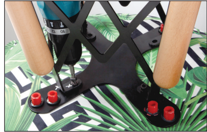
Şekil / Fig. 2